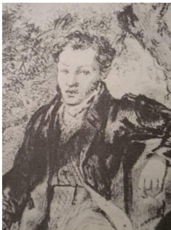
В. Ваньковіч Партрэт А. Пушкіна пад дрэвам. 1828 г. Дэталі малюнка.