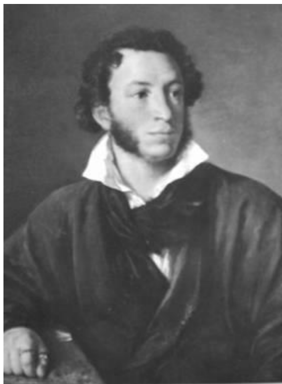
В.А.Трапінін Партрэт А.С. Пушкіна. 1827