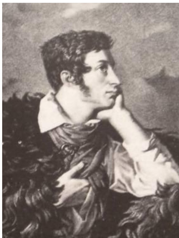
В. Ваньковіч Партрэт А. Міцкевіча на скале Аюдаг. 1828 г. Дэталі карціны.