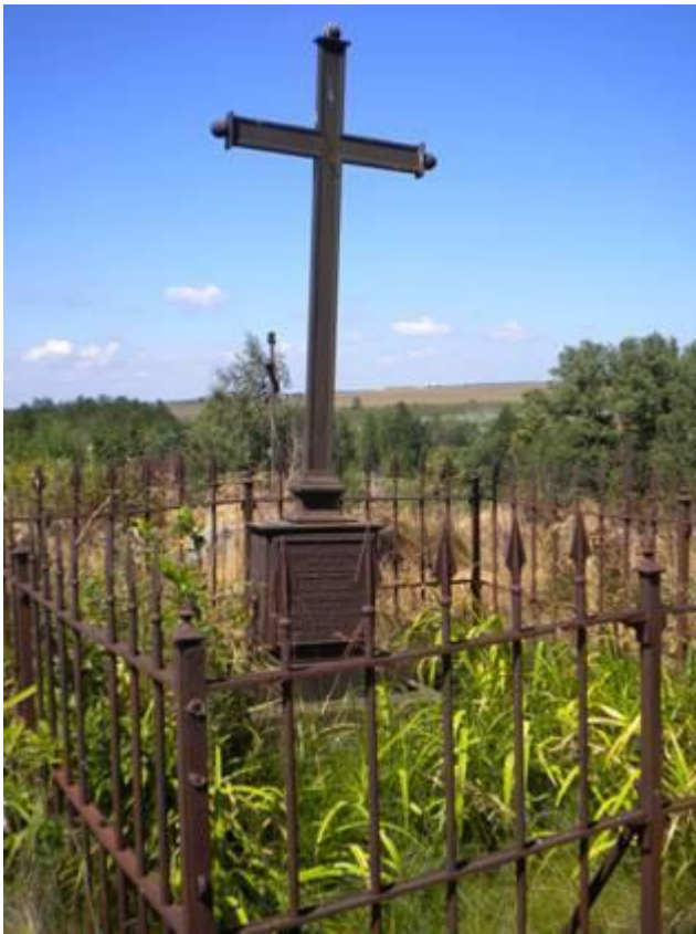
Вялікая Бераставіца. Магіла А. Мінкевіча і яго жонкі Юліі. XIX ст. Фота 2010