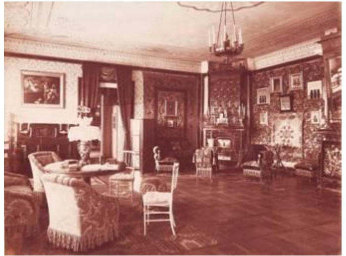
Інтэр'ер Вялікага салона першага палаца Касакоўскіх у Вялікай Бераставіцы. 3 фота 1901 г.

Нарадзіўся Станіслаў Шчэнсны ў Гамбургу (Германія) 4 студзеня 1795 г. Аднак выхаванне і адукацыю атрымаў у Францыі (парыжскім ліцэі Банапарта). Вайсковую службу праходзіў у войску польскім, але добраахвотнікам на ваенныя дзеянні 1812-га года не трапіў, магчыма з-за маладосці. Пачаў працаваць у канторы Часовай Рады, а з 1818 г. стаў камерюнкерам двару Каралеўства Польскага. У тым жа годзе прызначаны да расійскага пасольства ў Рыме.