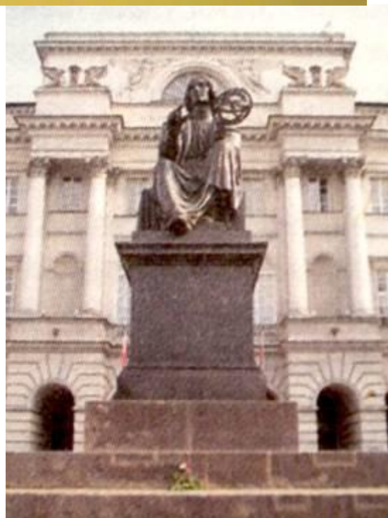
Б. Тарвальдсан Помнік М.Каперніку. 1829-32 Бронза. Варшава (сучасны выгляд)