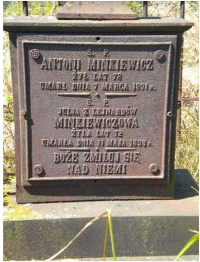
Дэталі металічнай табліцы з жыццярыса Мінкевічаў. Фота 2010