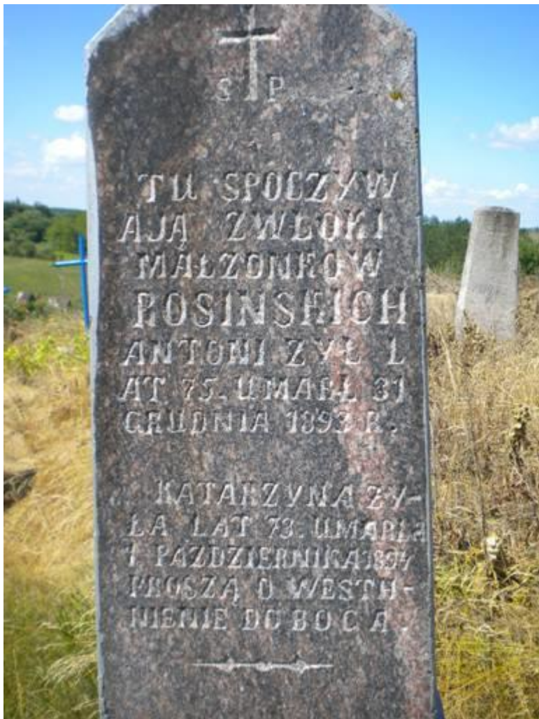
Вялікая Бераставіца Магіла А. Расінскага і яго жонкі Катажыны. XIX ст. Фота 2010