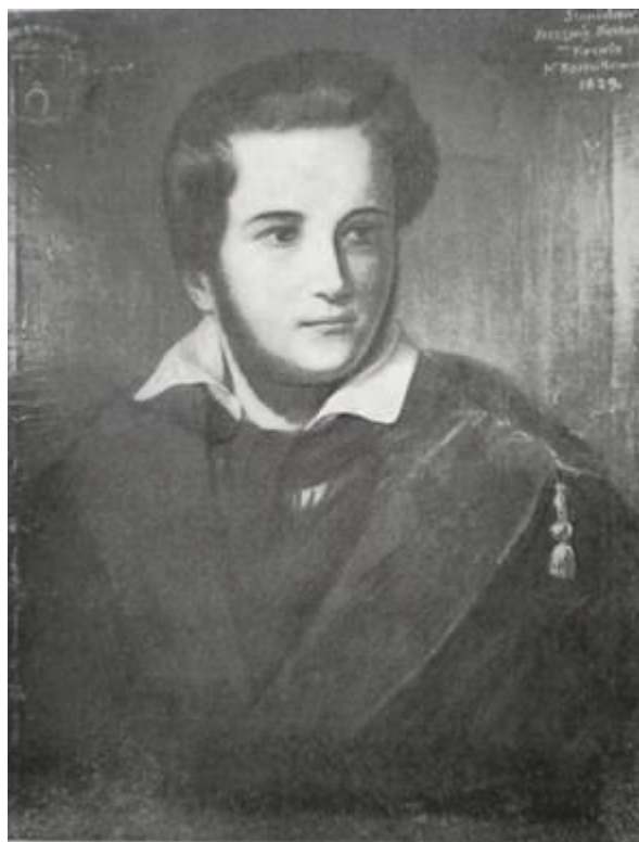
С.Ш. Касакоўскі Аўтапартрэт. 1829