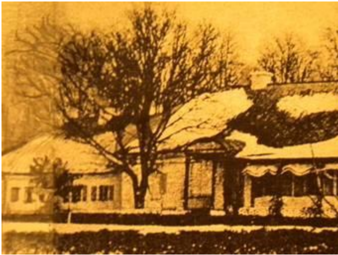
Першы палац Касакоўскіх у Вялікай Бераставіцы. (злева - палац Хадкевічаў). 3 фота 1916 г.