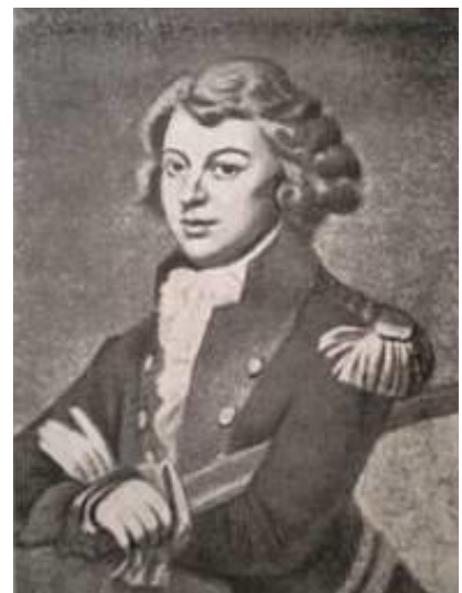
Ю.Пешка Партрэт Ю.Д.Касакоўскага, вялікага лоўчага ВКЛ. 1793-94