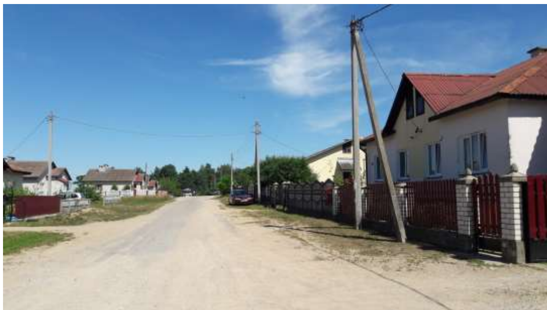
Вуліца імя сям'і Цівунчык-Арловых ў аг. Пагранічны

Імем сям'і Цівунчык-Арловых названа вуліца на малой радзіме Фёдара Міхайлавіча Арлова (Цівунчыка) ў аг. Пагранічны Бераставіцкага раёна Гродзенскай вобласці (Рэспубліка Беларусь).