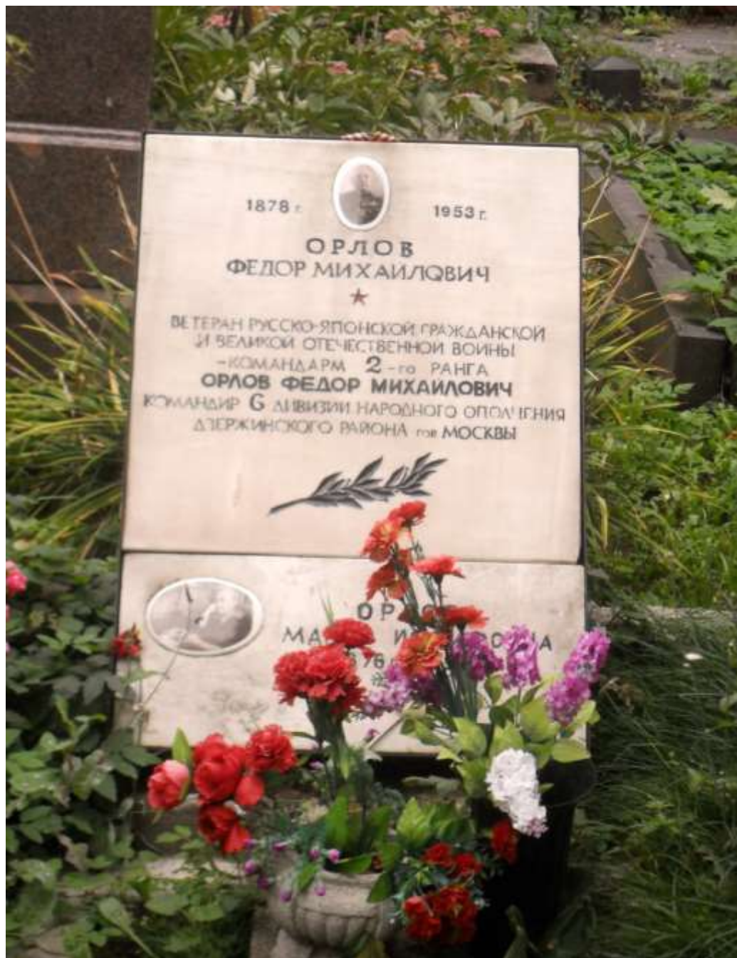
Магіла Ф.М. Арлова (Цівунчыка) на Новадзевічых могілках у Маскве

Памёр Фёдар Міхайлавіч Арлоў (Цівунчык) у 1953 годзе. Пахаваны на Новадзевічых могілках у Маскве.