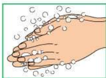
3 Намылить руки