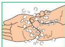
9 Охватить запястье левой руки большим и указательным пальцами правой руки, вымыть. Повторить для запястья правой руки