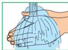
1 Намочить руки