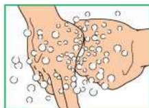
6 Охватить основание большого пальца левой руки большим и указательным пальцами правой руки, вымыть. Повторить для большого пальца правой руки