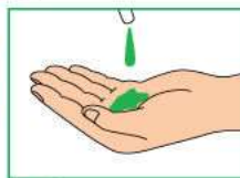
2 Нанести на руки необходимое количество жидкого мыла