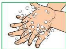
4 Правой ладонью вымыть обратную поверхность левой ладони, поменять руки