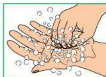
7 Тереть круговыми движениями ладонь левой руки кончиками пальцев правой руки, поменять руки