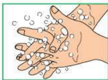
5 Вымыть внутренние поверхности пальцев движениями вверх и вниз