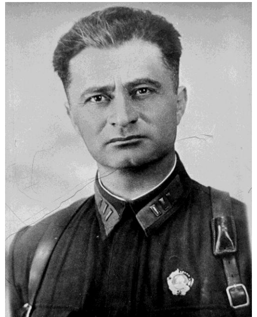
Г.Н. Цітаішвілі. Здымак 1941 г.

На адным з напрамкаў правага фланга наступаючых савецкіх войскаў змагаліся з фашыстамі гвардзейцы 250-ай стралковай дывізіі, якой камандаваў Г.Н.Цітаішвілі. Байцы замацаваліся на адбітых у ворага рубяжах паралельна дарозе Вялікая Бераставіца – Алекшыцы і з нецярпеннем чакалі загаду рухацца наперад. Усе жылі адной думкай - як мага хутчэй ачысціць родную зямлю ад фашыстаў. І калі ў батальёне або роце знаходзіўся хто-небудзь з вышэйшага