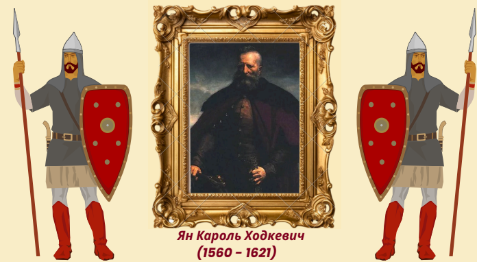
Ян Кароль Ходкевич (1560 – 1621)

Политический деятель и военачальник в Великом княжестве Литовском.